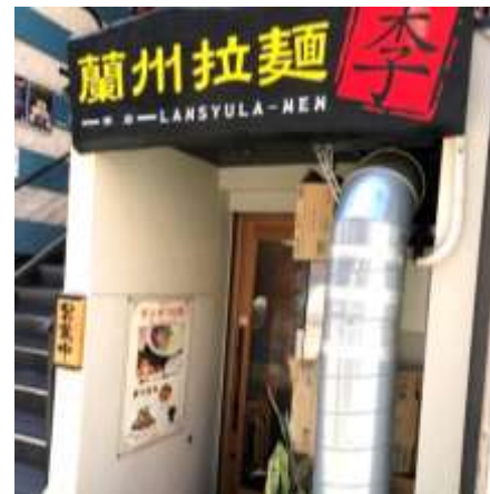
所在地は名古屋市中区栄 4-4-9

メニューはそれほど豊富ではありませんが、辣油の量で辛さが調整できる蘭州拉麵や激辛の麻辣牛肉麵など、中国本場の拉麵を味わってみてください。