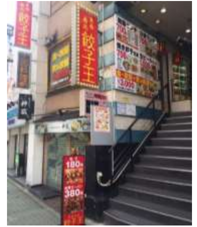
住所は名古屋市中区栄 4-4-9

余談ですが、「餃子王」の読み方は「ぎょうざおう」ではなく「ギョーザワン」だそうです。